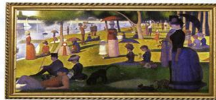
조르주 쇠라, "그랑자트 섬의 일요일"(1884~1886년)

일요일 오후 파리의 시민이 섬에 나와 쉬고 있다. 파리에는 빠르게 진행되는 산업화로 '주말'이라는 개념이 등장하였고, 공장 노동자들이 쉴 수 있는 날로 쓰이기 시작했다. 이 그림의 등장인물은 귀족층이 아니라 일주일에 하루 쉴 수 있게 된 평범한 서민이자 노동자들이 대부분이다. 이 그림은 그들의 무표정하고 생동감 없어 보이는 모습을 통해 산업화 시기의 피로감을 묘사하였다는 평가를 받고 있다.