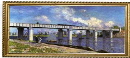
클로드 모네, "아르장티유의 철도교"(1873년)

푸른 강에 하얀 돛단배들이 한가롭게 떠 있고, 그 위로는 철교가 서 있다. 기차가 지나가며 뿜어내는 흰 연기가 하늘의 구름과 뒤섞인다. 산업화의 산물인 기차가 개통되자 대도시와 교외 지역이 1시간 이내에 연결되었다. 덕분에 파리의 화가들도 쉽게 교외로 나가 그림을 그리고 여유를 즐길 수 있게 되었다. 이 그림은 산업화 시기에 빠르게 발달하는 문명에 대한 예찬을 담고 있다는 평가를 받고 있다.