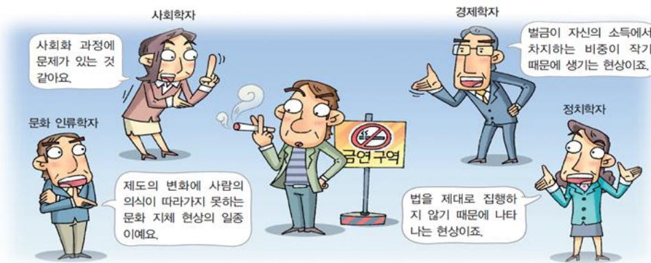
생각 더하기 금연 구역 내에서 담배를 피우는 현상을 개별 학문에서 접근해야 할까, 간학문적 관점에서 접근해야 할까?

아래 그림은 금연 구역 내에서 담배를 피우는 현상에 대해 사회 과학자들이 자신들이 연구하는 학문적 개념을 활용하여 그 원인을 분석하는 모습이다.