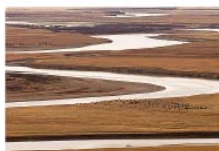
Meandry řeky Chuang he