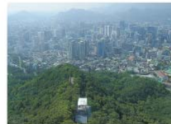
Soul ze soulské televizní věže

Mongolsko je rozlehlá země, avšak velmi řídko osídlená. Většinu území zaujímají suché stepi a poušť Gobi. Mongolové jsou tradiční pastevci, kteří kočují na koních se stády ovcí nebo dobytka za pastvinami. Mnozí se usazují ve městech a pracují v dolech nebo průmyslu, ale země zatím patří k velmi chudým. Z mocné středověké Mongolské říše zbyla jen národní hrdost.