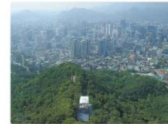
Soul ze soukromé televizní věže

Mongolsko je rozlehlá země, avšak velmi řídko osídlená. Většinu území zaujímají suché stepi a poušť Gobi. Mongolové jsou tradiční pastevci, kteří kočují na koních se stády ovcí nebo dobytka za pastvinami. Mnozí se usazují ve městech a pracují v dolech nebo průmyslu, ale země zatím patří k velmi chudým. Z mocné středověké Mongolské říše zbyla jen národní hrdost.