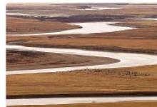
Meandry řeky Chuang he