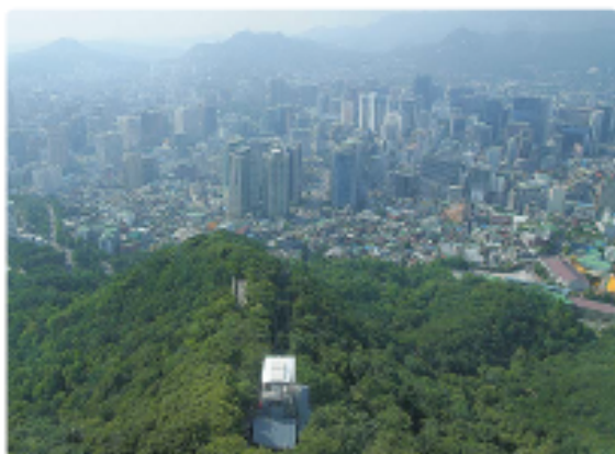
Soul ze soulské televizní věže

Korejský poloostrov je od korejské války (1950–1953) rozdělen na dva státy. Korejská republika na jihu patří k rychle se rozvíjejícím státům s velkým vývozem spotřebního zboží, elektroniky a aut. Zpočátku byla země podporována Japonskem a Spojenými státy. Dnes už jim začíná konkurovat.