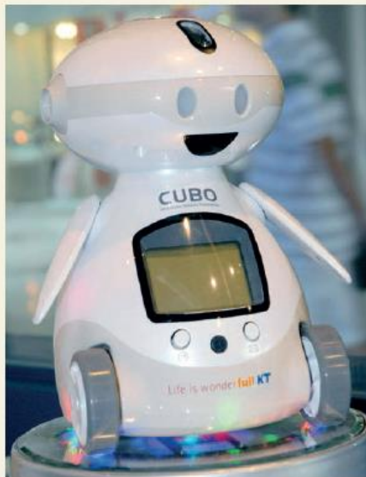
7.3. ábra. A tanulást segítő robot, ami beolvassa a szöveget, majd eltárolja. Amikor szükség lesz az információra, vagy elmondja vagy kivetíti. Természetesen segít a digitális tankönyvek használatában is. Erre pedig nagy szükség van, hiszen Dél-Koreában 2015-től csak ilyenből tanulnak a gyerekek.

Milyen termékeket állítanak elő ezek a nagyvállalatok?