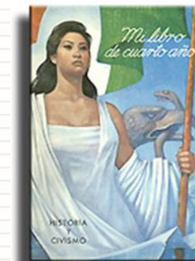
1959 Libro de texto, portada.