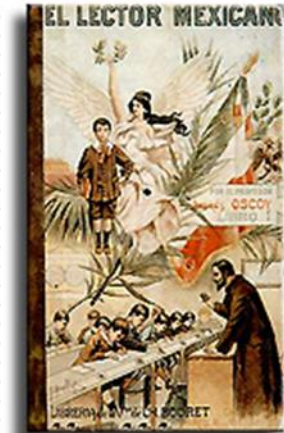
Portada del Libro Lector Mexicano de Andres Oscoy, 1902, publicado en la revista Chio