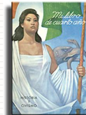
1959 Libro de texto, portada.