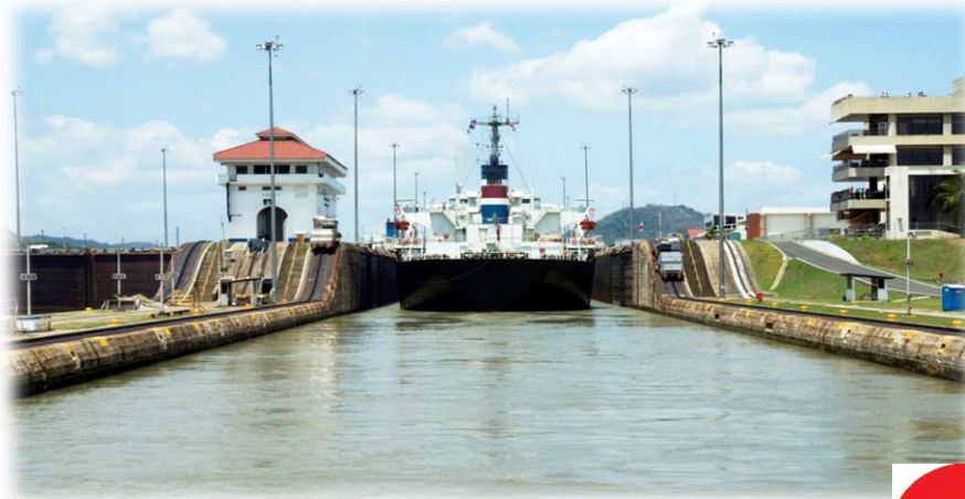
Canal de Panamá (파나마 운하)