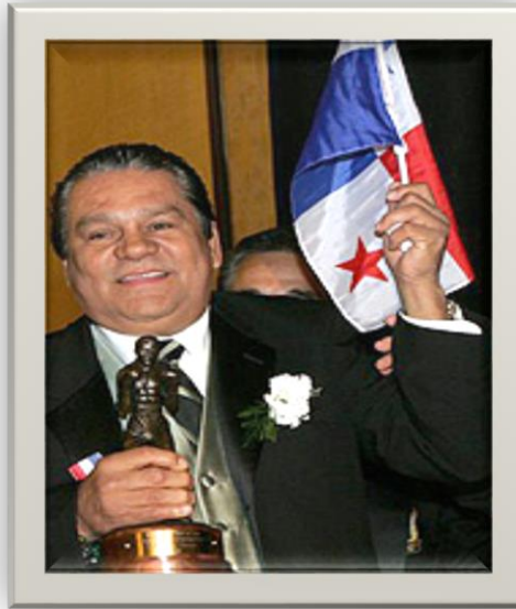
Roberto mano de piedra Durán (로베르토 두란, 돌 주먹)