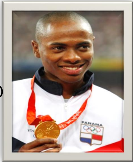
Irving Saladino (이르빙 살라디노)