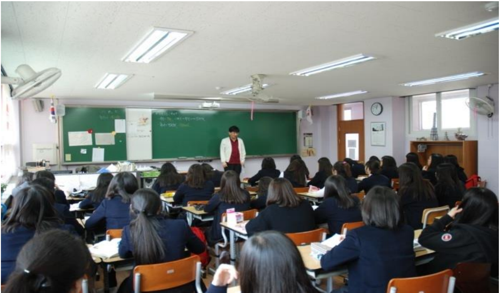
Clase de historia con maquetas exhibidas en la Escuela Bachillerato Changmun