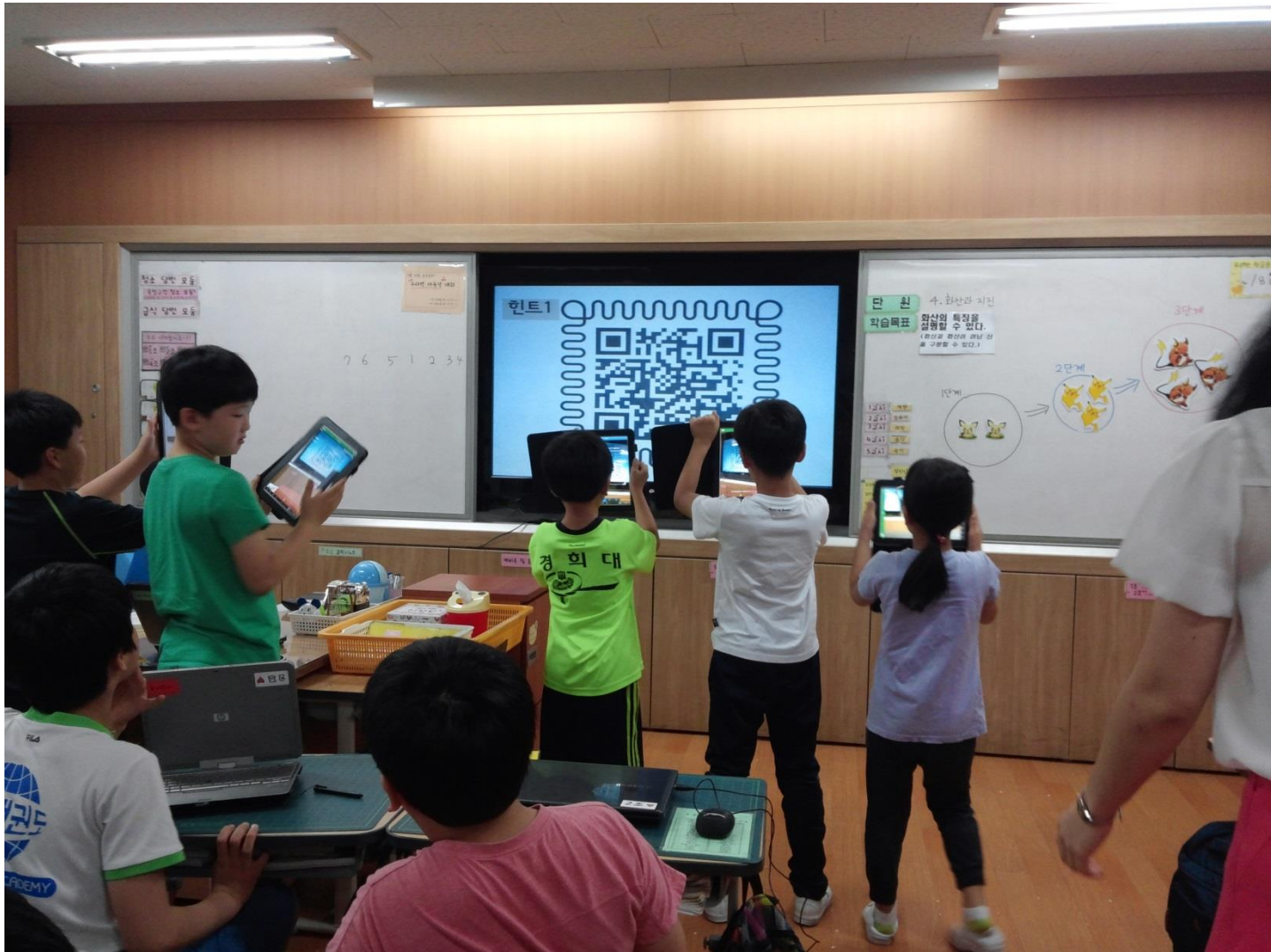
Escuela Primaria de Guil en Seúl (junio de 2014)