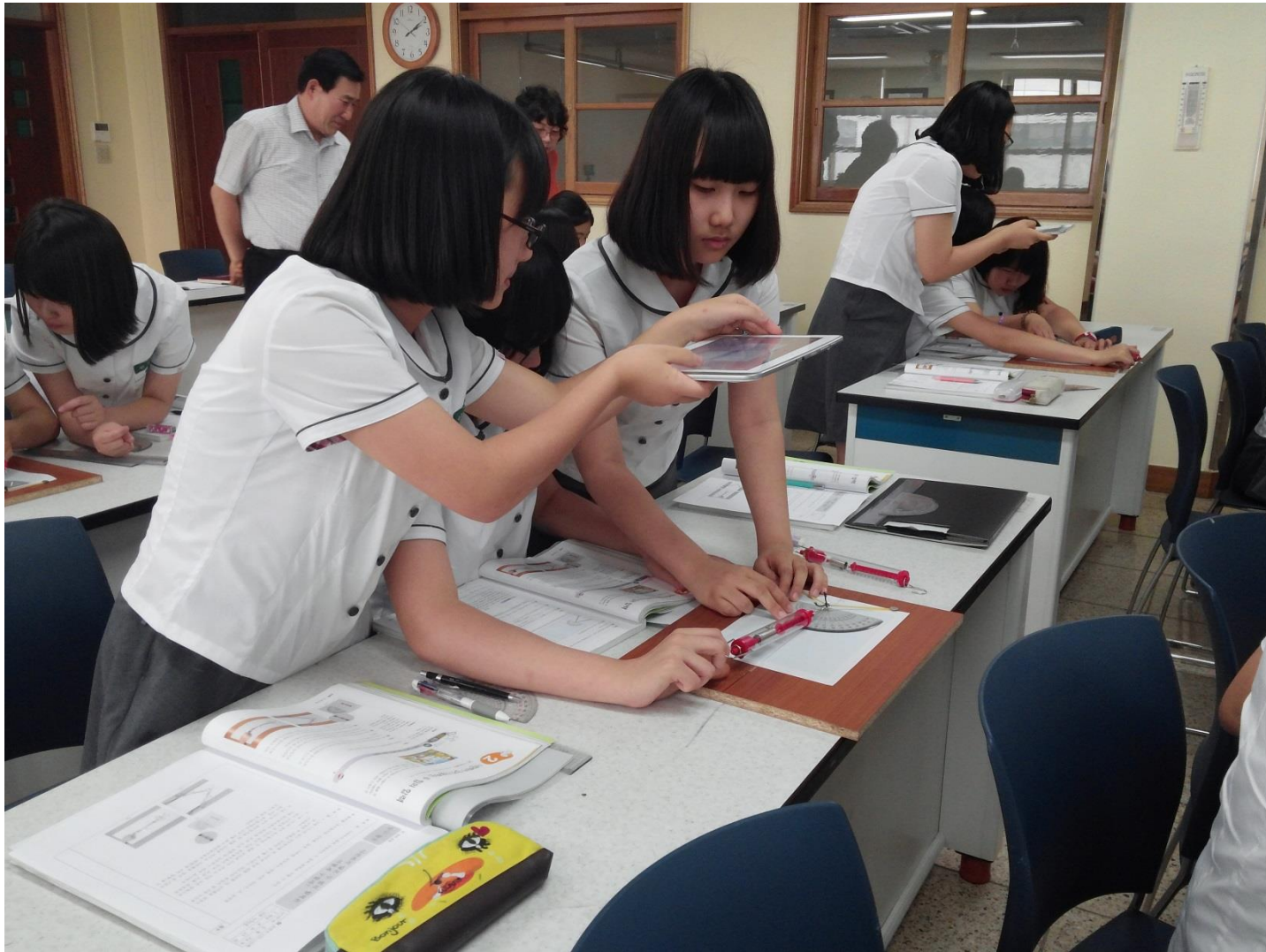
Escuela Secundaria de Jijok en Daejeon (junio de 2014)