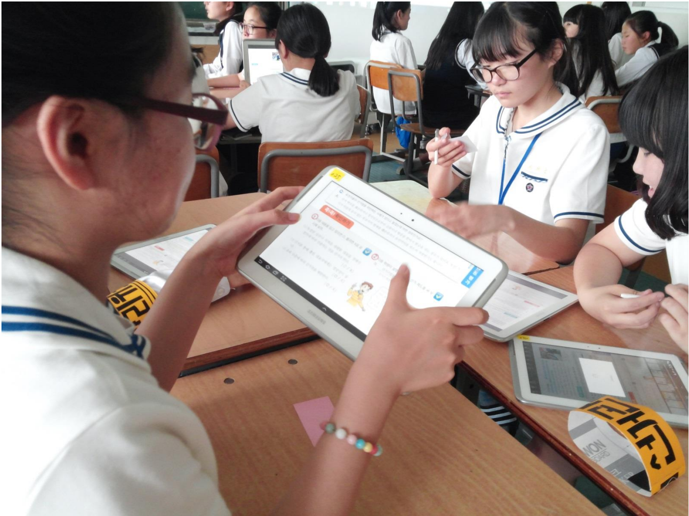
Escuela Secundaria de Sinsung en Jeju (mayo de 2014)