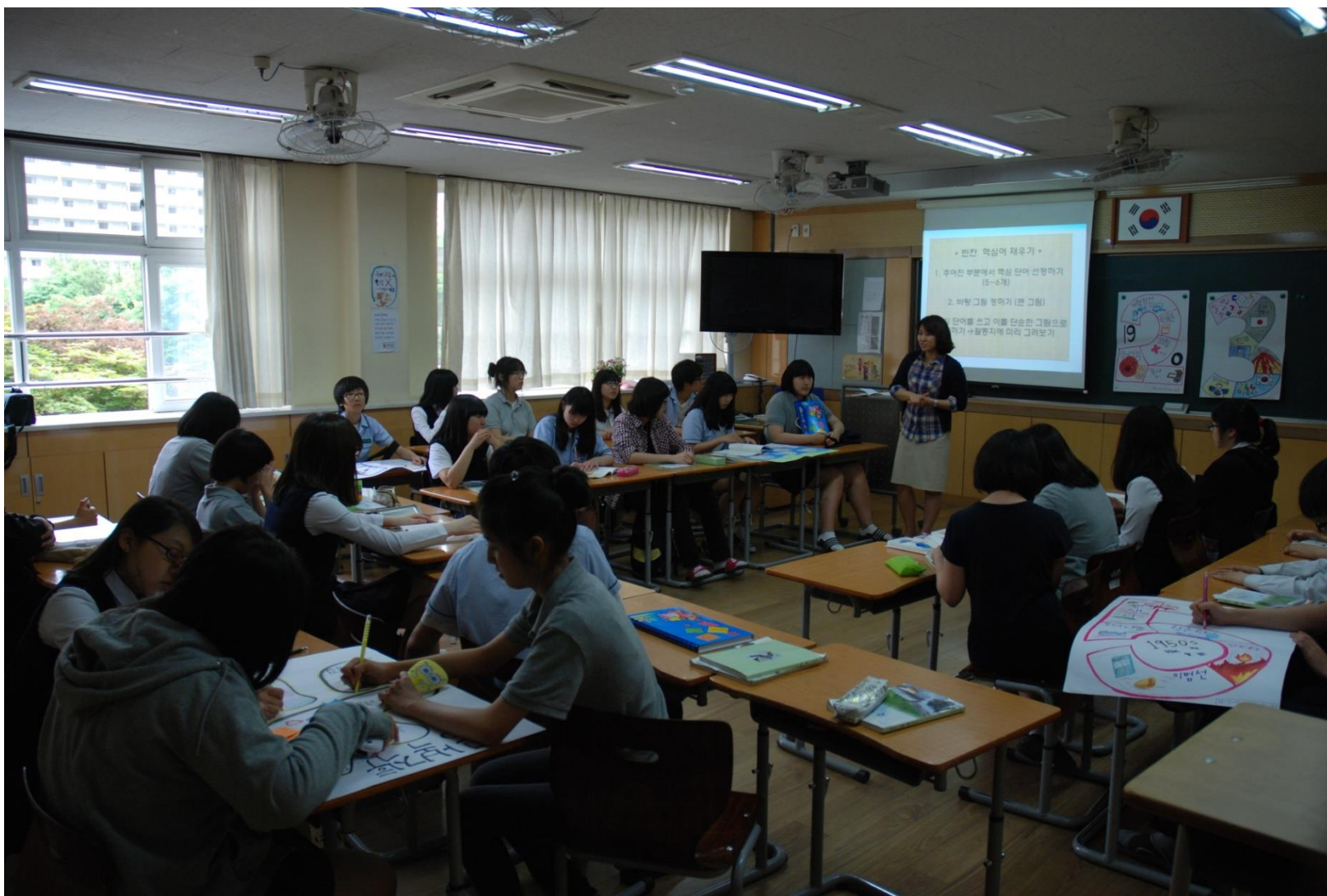
Clase del coreano en la aula con pantalla y TV de gran tamaño instalados de la Escuela Secundaria Cheongsol