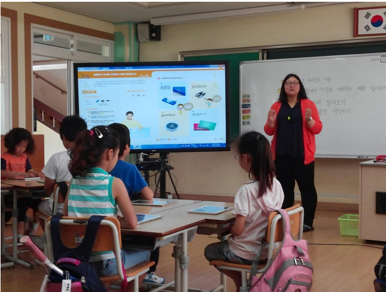
Escuela Primaria de Shille en Jeju (mayo de 2014)