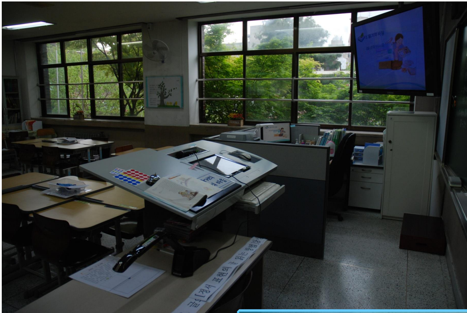
전자교탁과 실물화상기, 대형TV가 있는 서울사대부중